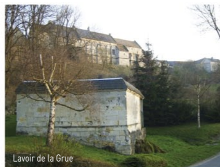
Lavoir de la Grue

Sur la motte de Poulandon , un ancien château de bois à dû exister, défendu par la pente et des épines, avant qu'une nouvelle construction ne soit bâtie à partir du XVème à son emplacement actuel. Celui qui l'habitait était seigneur de son fief, vassal du seigneur de Pierrefonds.